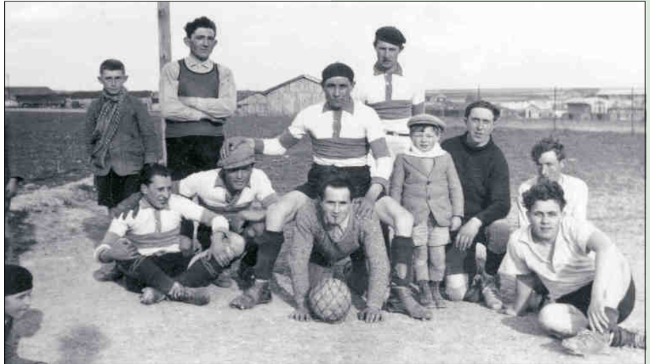
Les infrastructures utilisées ont favorablement évolué depuis la création du club dans un village où n'existait aucun terrain de jeu. Un champ était alors mis à la disposition des joueurs par les cultivateurs. Cette photo a été prise en 1936, approximativement à l'emplacement du boulodrome Piccoli.

Stade municipal route de Condé : dans un cadre agréable et sécurisé pour les plus jeunes, le stade bénéficie d'un cadre verdoyant et abrité. Rénové en 1994, il est équipé de 3 vestiaires, de locaux de rangement et d'une buvette. Les supporters peuvent s'abriter dans une tribune couverte avec gradins. De nouveaux travaux d'entre-