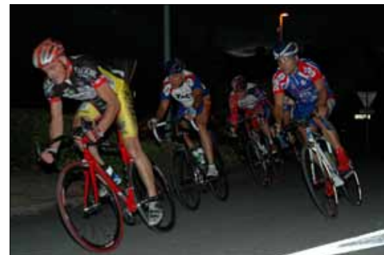
Critérium semi-nocturne de 2008

Pour cette 11 e édition, l'inscription au calendrier de la Fédération avait lieu dès le mois de décembre après accord de la commune. C'étaient les premiers contacts entre le TGVS et la Commission des Fêtes. Mais c'est surtout à partir du mois de mai que l'activité autour de la course va prendre de l'importance. C'est le moment de constituer