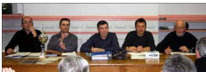
L'assemblée générale du TGVS, en décembre 2009.