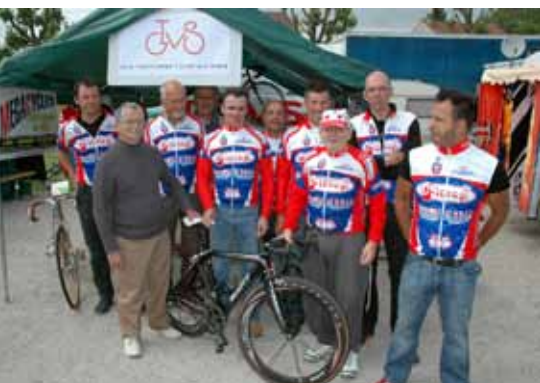
Sur le stand du TGVS, lors de la foire de Guignicourt, le 18 mai 2008.

La participation est directement liée à la météo, incertaine comme cette année. C'est une présence moindre, l'exercice sur un circuit en ville et sur sol mouillé est réservé aux funambules. Le jour de la course, le club et la commune sont sur le pied de guerre. Quelques impondérables de dernière minute, absence d'éclairage rue Mortimer, il faut redéfinir la distance de la